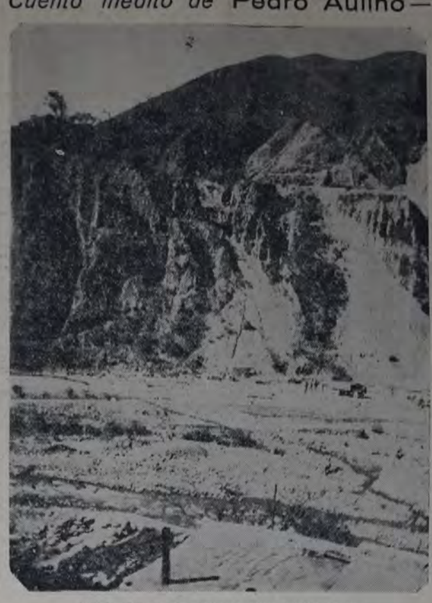
VISTA DE LA QUEBRADA DEL TORO (Salta)